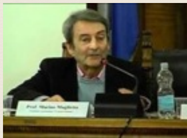
PROF. MARINO MAGLIETTA

Marino Maglietta ( www.crescere-insieme.org ) - ideatore dell'affidamento condiviso ed estensore del testo base che condusse alla legge 54/2006 – per quanto attiene il D.lgs 154 è estensore di un esposto al Capo dello Stato e delle interrogazioni rivolte al Ministro della Giustizia n. 4/03235 e 5/01593 ed è autore delle prime pubblicazioni uscite sulle criticità del decreto su riviste giuridiche: Quotidiano del Diritto , Guida al Diritto , Persona e Danno .